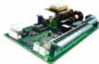
Carte électronique 624BLD (intégré) Voir page 178