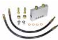
Valve anti-vandalisme pour sauvegarder l'intégrité du système hydraulique en cas de forçement de la lisse 401066