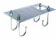
Plaque de fondation