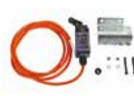
Capteur de dépassement pour lisses rondes dégondables