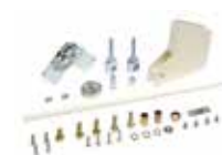
Kit articulation - H max plafond 3 m (uniquement pour les lisses rectangulaires standard)