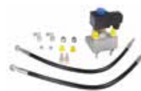
Groupe antipanique pour déverrouillage manuelle en cas de coupure de courant ♦