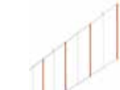
Kit herse longueur 2 m ♦