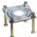
Plaque de fondation pour lyre