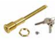
Serrure de déverrouillage avec clé personnalisée (du n° 1 au n° 10)