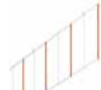
Kit herse longueur 3 m ♦