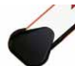
Flasque de fixation pour lisse rectangulaire ♦