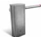
Coffre acier INOX