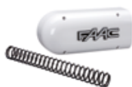
Flasque et ressort d'équilibrage S