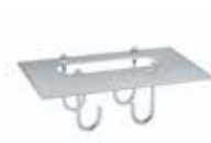
Plaque de fondation