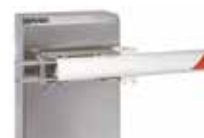
Flasque de fixation pour lisse ronde dégondable - (INOX)

Il est impossible d'utiliser des herse, le pied d'appui et la lyre avec les lisses rondes dégondables.