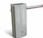
Coffre Gris RAL 9006